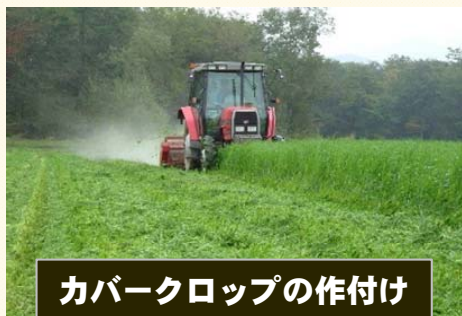
カバークロップの作付け

※堆肥の施用とは、「炭素貯留効果の高い堆肥の水質保全に資する施用」の取組 ※同一のほ場において2つの取組を一定の条件のもとで実施する場合は各取組に対して支援